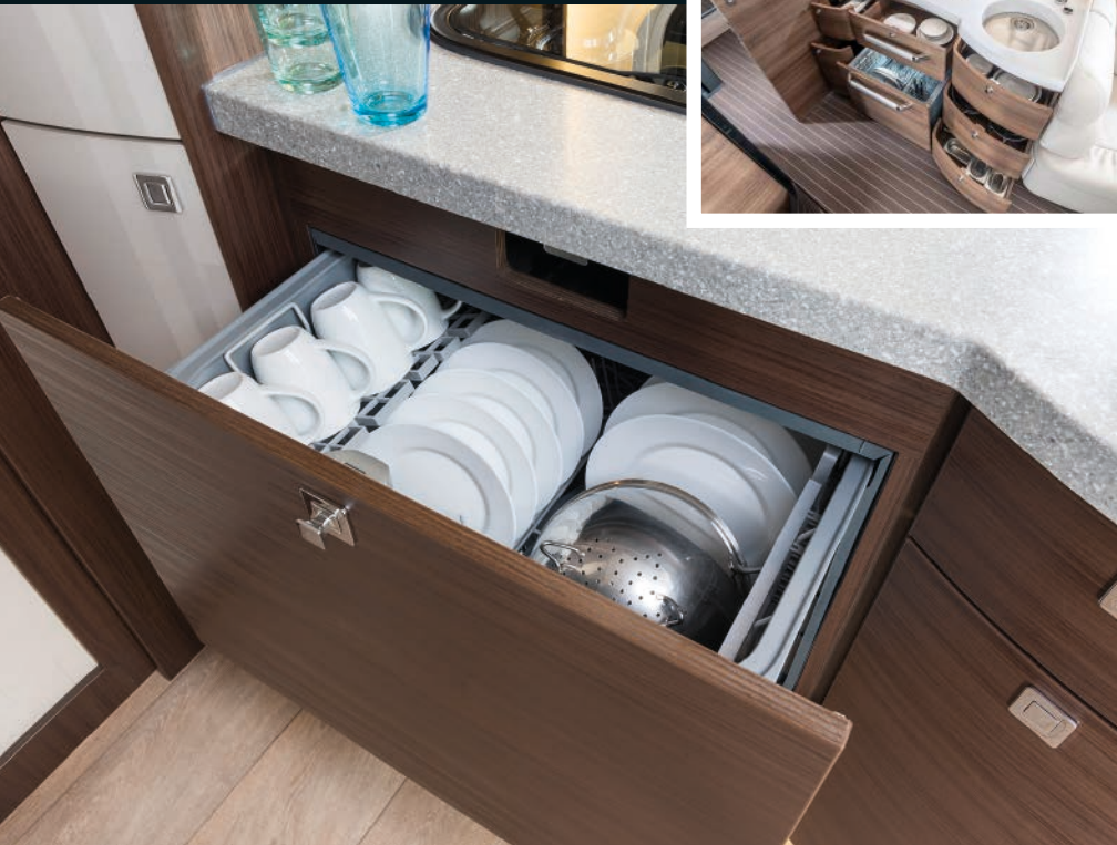
Concord - Carisma und Liner mit Schubladengeschirrspüler