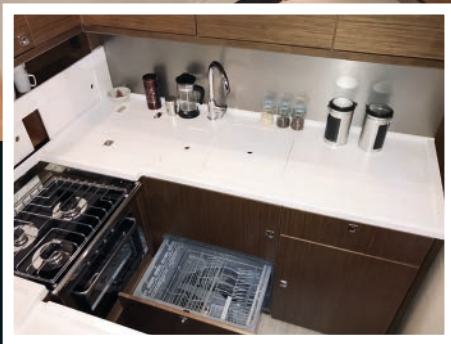
Bild oben: 12-Meter-Yacht Hanse 575 mit Doppel Schubladengeschirrspüler

Bild links: 10-Meter-Motorboot Bavaria R Baureihe mit Single Schubladengeschirrspüler